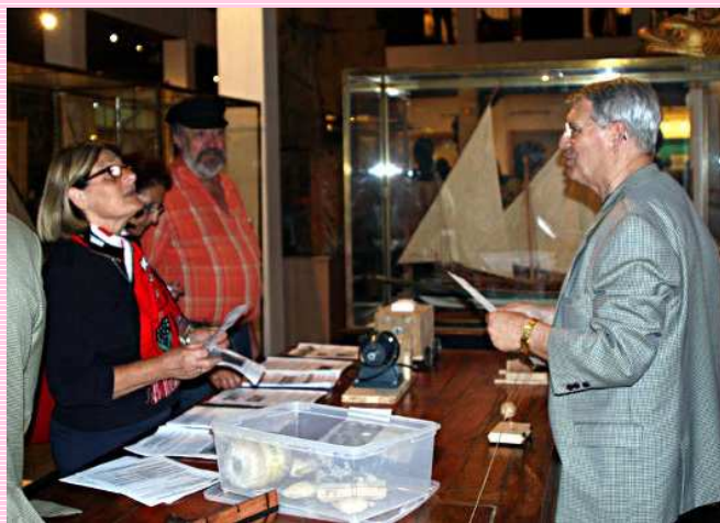
Discussion aux « Nuits des musées » à Toulon