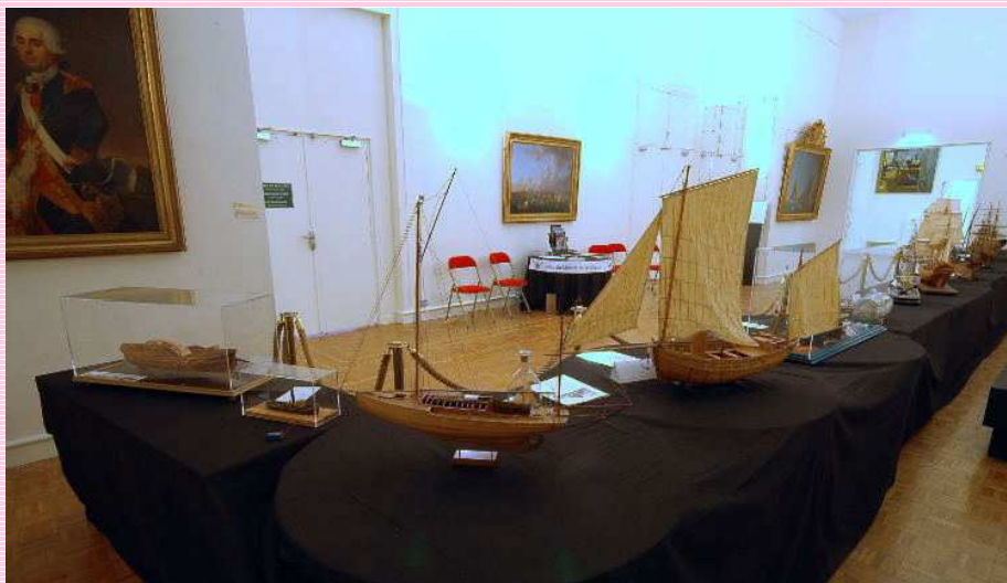
Les tables de l'AAMM aux journées du patrimoine à Paris

Le cycle des conférences du Lundi a repris le 5 octobre (programme disponible sur le site Internet).