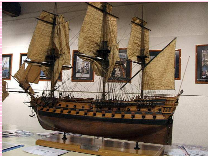
Un modèle présenté par l'AAMM aux journées du patrimoine à Brest

Elle tiendra également un stand au salon nautique sur l'espace de la Fédération Française de Modélisme Naval, du 5 au 13 décembre.